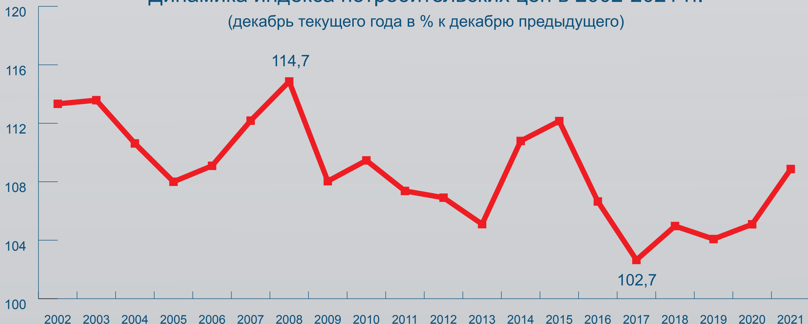
Динамика индекса потребительских цен в 2002-2021 гг. (декабрь текущего года в % к декабрю предыдущего)