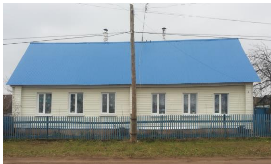
Учитывается как 2 единицы