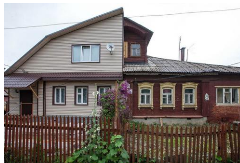
Учитывается как 2 единицы