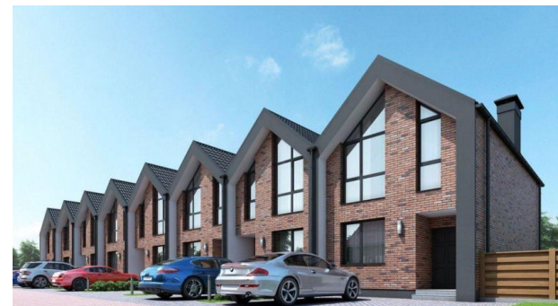
Учитывается как 8 единиц

Важно: не путать дома блокированной застройки и многоквартирные дома.