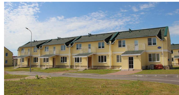
Учитывается как 4 единицы